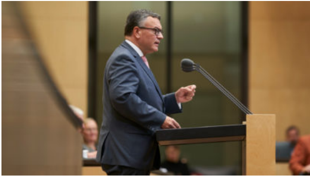
Staatsminister Dr. Florian Herrmann, MdL.

Der Bundesrat ließ das Gebäudeenergiegesetz passieren, ein bayerischer Antrag auf Anrufung des Vermittlungsausschusses scheiterte im Plenum. Das Gesetz sieht vor, dass ab 2024 in neue Gebäude in Neubaugebieten nur noch zu 65 Prozent mit erneuerbaren Energien betriebene Heizungen eingebaut werden dürfen. Für Bestandsbauten und Neubauten außerhalb von Neubaugebieten gilt die 65-Prozent-Regelung je nach Vorliegen einer kommunalen Wärmeplanung spätestens ab dem 1. Juli 2028.