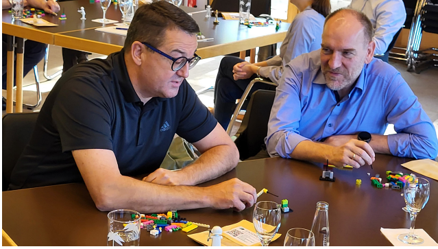
Teilnehmer des Digital Governance Programs

Das berufsbegleitende Digital Governance Program wurde speziell für stellvertretende Abteilungsleiterinnen und stellvertretende Abteilungsleiter der obersten bayerischen Dienstbehörden konzipiert. Die berufsbegleitende Seminarreihe bereitet die Teilnehmenden darauf vor, die digitale Transformation der Verwaltung aktiv zu gestalten und Führungsverantwortung zu übernehmen. Gleichzeitig dient das Programm der Netzworlbildung innerhalb der bayerischen Verwaltung und dem Aufbau von professionellen Kontakten über die Landesgrenzen hinaus.