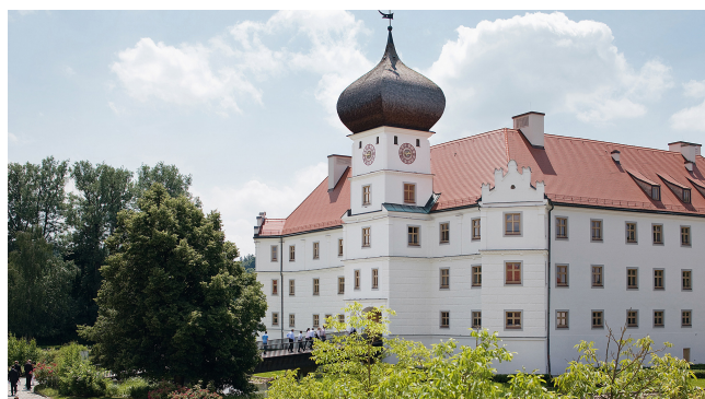
Schloss Hohenkammer.

Das Internationale Seminar wird alle zwei Jahre von der Bayerischen Staatskanzlei in Kooperation mit dem Generalkonsulat der Vereinigten Staaten von Amerika und einem weiteren Gastland organisiert. Es präsentiert renommierte Referentinnen und Referenten und behandelt aktuelle, grenzüberschreitende Themen. Das Ziel ist die Förderung der internationalen Kompetenz der bayerischen Ministerialverwaltung. Die Arbeitssprache ist daher Englisch.