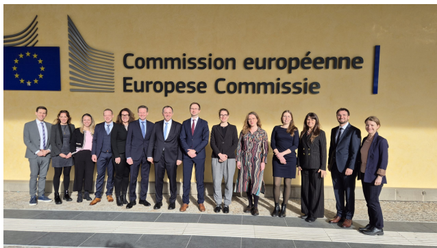
Gruppenbild der Teilnehmer des Exzellenz Programms Europa.