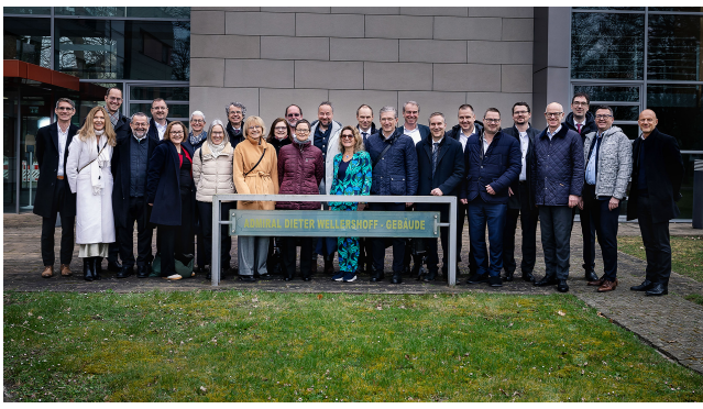
XI. TOP Management Programm bei der Führungsakademie der Bundeswehr in Hamburg.