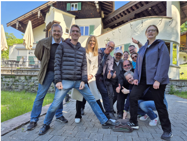
Teilnehmerinnen und Teilnehmer TOP Management Programm beim Outdoor-Teambuilding.

Mit dem TOP Management Programm sensibilisiert die Bayerische Staatsregierung die Spitzenführungskräfte der öffentlichen Verwaltung mit Seminaren und Informationsreisen für gesellschaftliche, wirtschaftliche und politische Entwicklungen. Die Teilnehmer bauen ihre Führungskompetenzen gezielt aus.