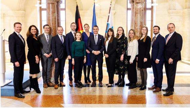
Teilnehmer des VII. Exzellenz Programms Europa.

Das Exzellenz Programm Europa bildet vielseitig und international einsetzbare Europa-Experten aus. Führungskräfte in der öffentlichen Verwaltung erweitern ihre fachspezifischen Kompetenzen und sprachlichen Kenntnisse.