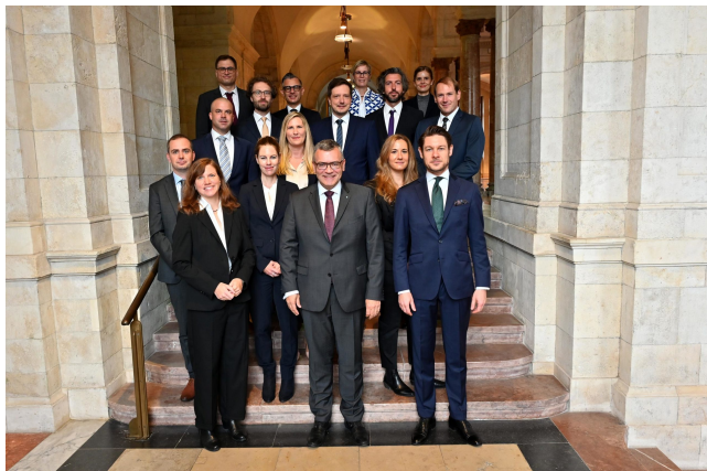
Gruppenfoto des 29. Lehrgangs für Verwaltungsführung.

Dauer: 10 Monate, die Teilnehmer sind für den Zeitraum des Lehrgangs vom Dienst freigestellt.