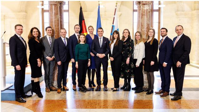
Teilnehmer des VII. Exzellenz Programms Europa.

Das Exzellenz Programm Europa bildet vielseitig und international einsetzbare Europa-Experten aus. Führungskräfte in der öffentlichen Verwaltung erweitern ihre fachspezifischen Kompetenzen und sprachlichen Kenntnisse.