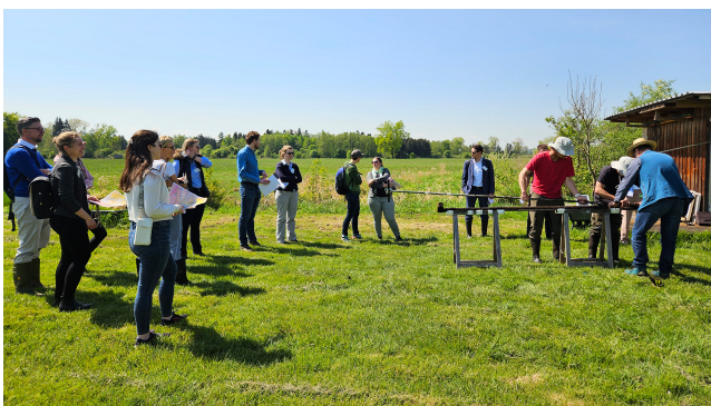
Am Puls der Zeit – Fortbildungsreihe für bayerische Spitzenbeamte in Sonderfunktionen.

Die Teilnehmer erhalten in einem eintägigen Seminar in knapper und prägnanter Form Einblicke und Impulse zu aktuellen Themen aus Wissenschaft, Wirtschaft, Kultur und Gesellschaft. Zum anderen werden Aspekte aufgegriffen, die den Arbeitsalltag in besonders belasteten Spitzenpositionen betreffen. Gleichzeitig bietet das Seminar einen Erfahrungsaustausch innerhalb dieser stark spezialisierten Zielgruppe sowie eine informelle Kontaktpflege. Wechselnde Seminarorte ermöglichen Einblicke in kulturelle, wissenschaftliche und weitere interessante Institutionen.