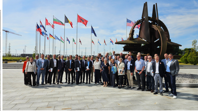
Teilnehmerinnen und Teilnehmer aus Bayern und Baden-Württemberg im Rahmen des Hallstein-Seminars beim Besuch der NATO in Brüssel.