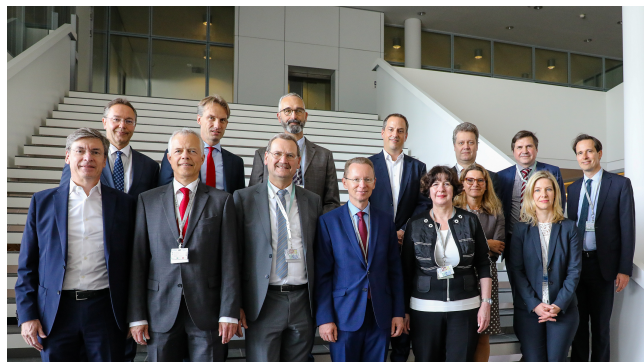
Gruppe der Personalabteilungsleiter bei der Infineon Technologies AG.

Das Begegnungsprogramm Brücken bauen richtet sich an Personalabteilungsleiter der Ressorts. Bei informellen Treffen tauschen sich die Spitzenbeamten mit Personalverantwortlichen nichtstaatlicher Organisationen und führender Unternehmen aus. Zeitgleich bieten diese Treffen auch eine Gelegenheit zu einem