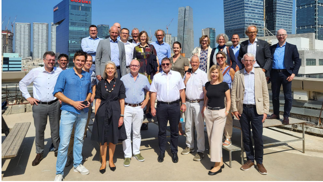
Gruppe des X.TOP Management Programms beim Besuch des ARD-Studios in Tel Aviv.