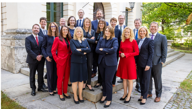
Gruppenfoto des 28. Lehrgangs für Verwaltungsführung.

Dauer: 10 Monate, die Teilnehmer sind für den Zeitraum des Lehrgangs vom Dienst freigestellt.