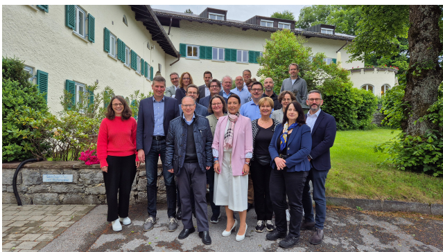
Teilnehmer des Digital Governance Programs

Das berufsbegleitende Digital Governance Program wurde speziell für stellvertretende Abteilungsleiterinnen und stellvertretende Abteilungsleiter der obersten bayerischen Dienstbehörden konzipiert. Die berufsbegleitende Seminarreihe bereitet die Teilnehmenden darauf vor, die digitale Transformation der Verwaltung aktiv zu gestalten und Führungsverantwortung zu übernehmen. Gleichzeitig dient das Programm der Netzworkebildung innerhalb der bayerischen Verwaltung und dem Aufbau von professionellen Kontakten über die Landesgrenzen hinaus.