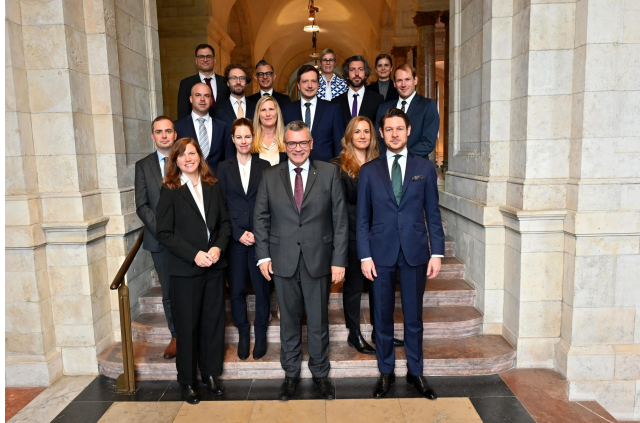
29. Corso di formazione in gestione amministrativa.