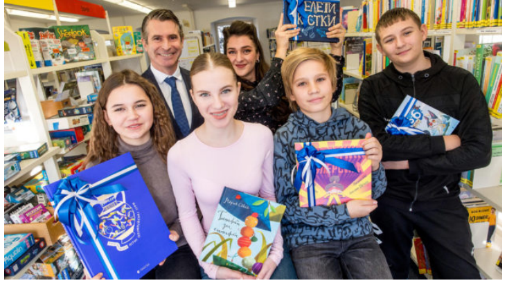
Українські дитячі книжки для міської ...