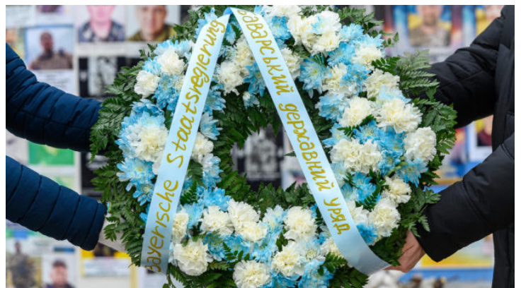
3-я річниця російського вторгнення ...