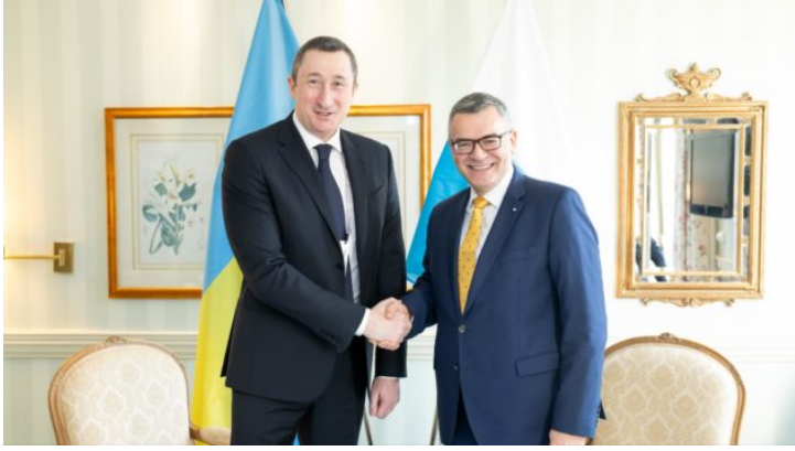
Мюнхенська безпекова конференція ...