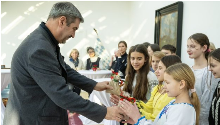
Прийом українських дітей у Державній ...