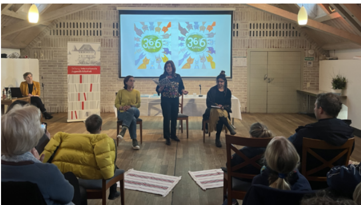
Заклучна подія дитячого книжкового ...

Бюро Вільної держави Баварія в Києві розпочало свою діяльність 5 березня 2018 року.