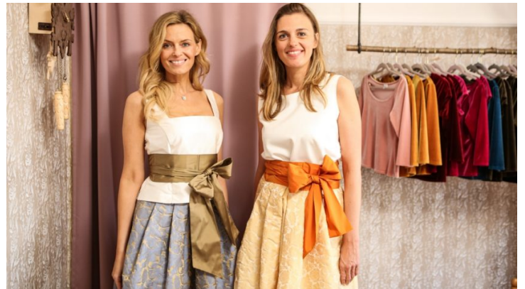
Und du so? Bayern und Tschechien im grenzenlosen Kultur-Austausch