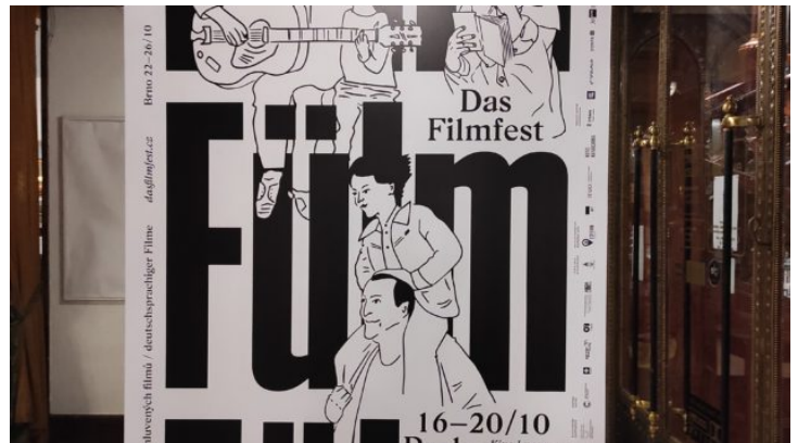
Festival deutschsprachiger Filme Das FILMFEST