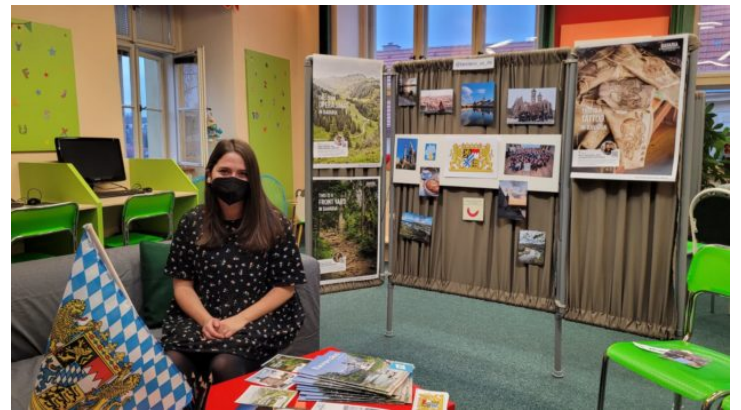
Lebendige Bibliothek für Schüler in Slaný (Schlan)