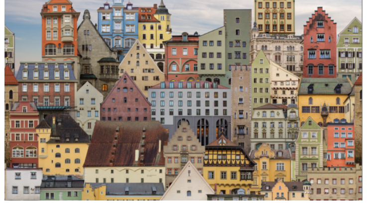
Verwandelte Fotos - Ausstellung der Künstlerin Lena Schabus ...