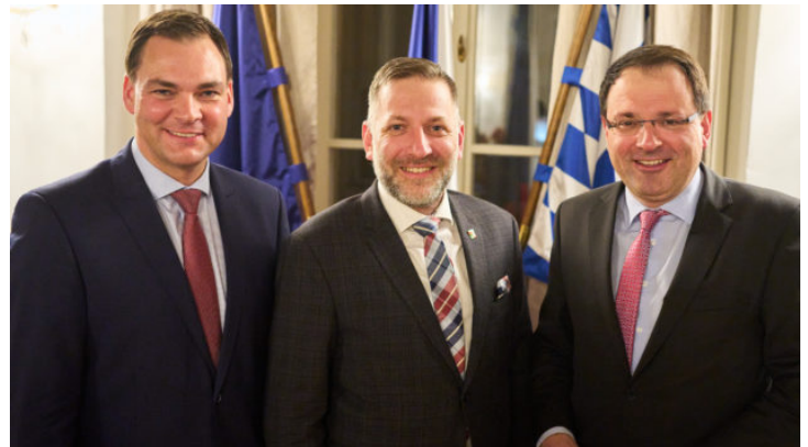
Bayerisch-tschechische Zusammenarbeit in der Grenzregion