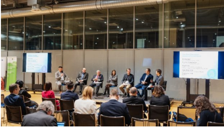
Netzwerktreffen „Sustainability and Space“ in Prag