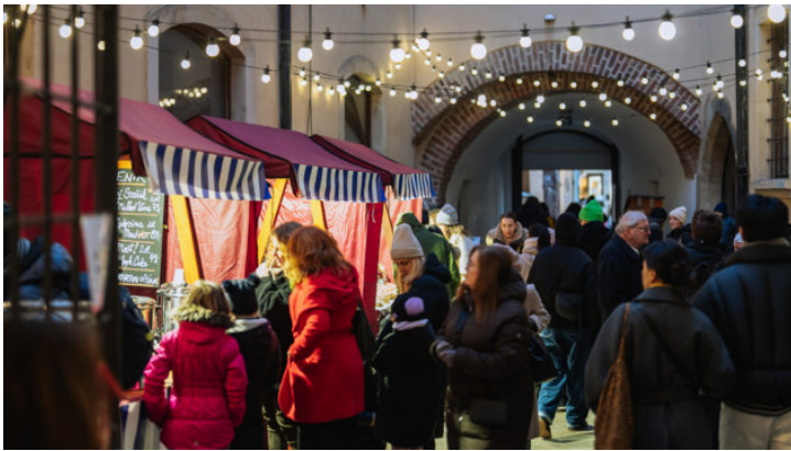
Adventsmarkt anlässlich 10 Jahre Bayerische Repräsentanz in ...

ubiläum 10 Jahre Repräsentanz des Freistaats Bayern in der Tschechischen Republik