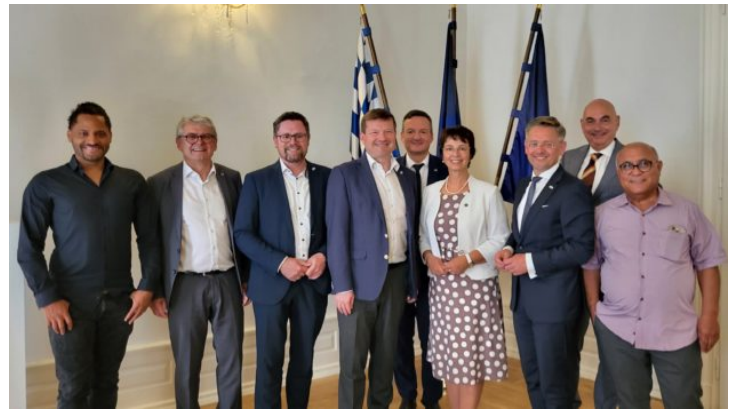
Europaausschuss des Bayerischen Landtags zu Besuch in Prag