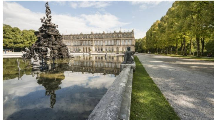
Vom Sofa nach Bayern: Führung durch das Schloss Herrenchiemsee ...