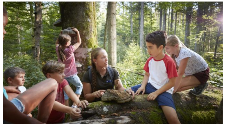
Vom Sofa nach Bayern: Wanderung durch den Nationalpark Bayerischer ...