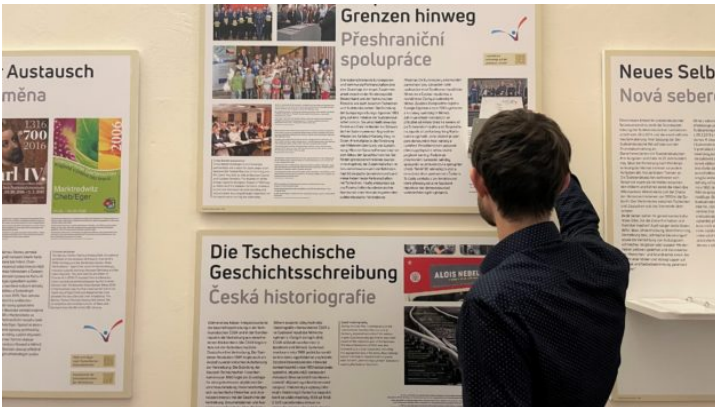
„So geht Verständigung – dorozumění“