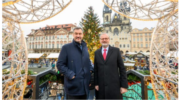
Ministerpräsident Dr. Söder in Prag