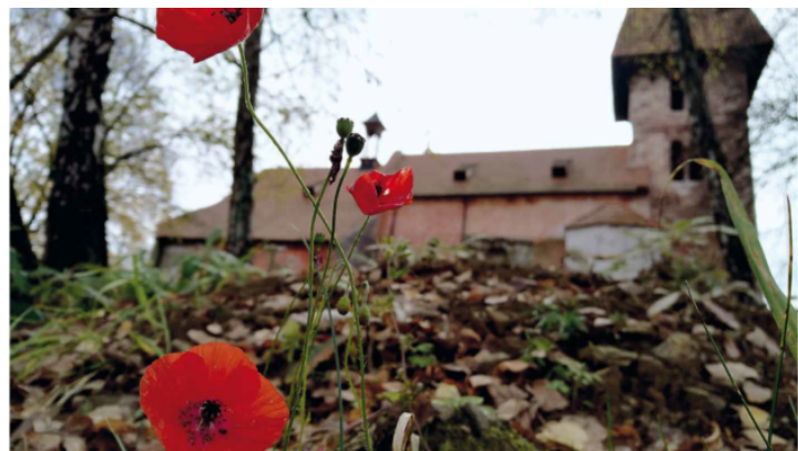
Ausstellung „Verblichen, aber nicht verschwunden“