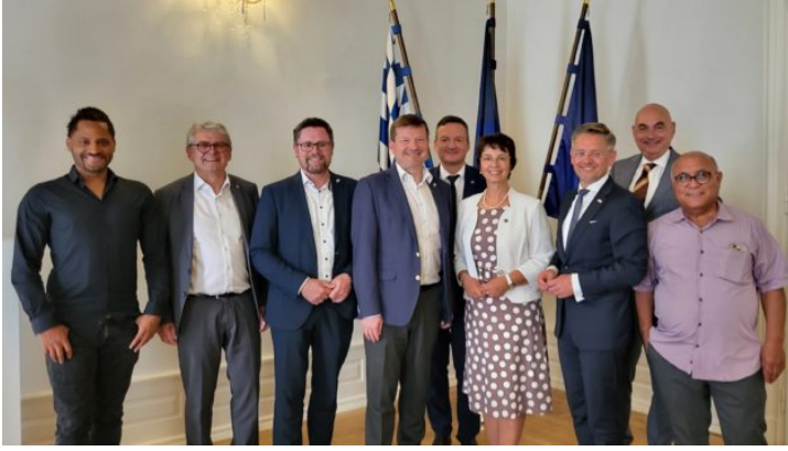
Europausschuss des Bayerischen Landtags zu Besuch in Prag