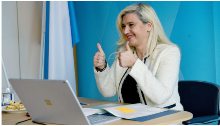
Nachbarsprache im O-Ton