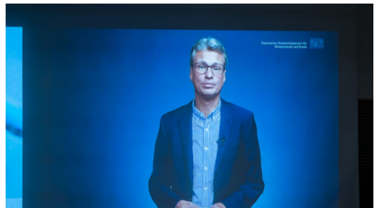
„Pathways into a Sustainable Future“: Konferenz zu grünen ...