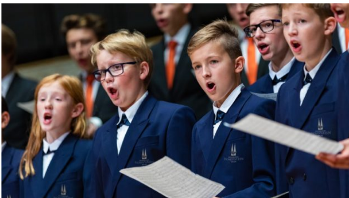
Regensburger Domspatzen in Tschechien – 10 Jahre Repräsentanz ...