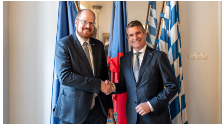
Festakt anlässlich 10 Jahre Bayerische Repräsentanz in Prag ...