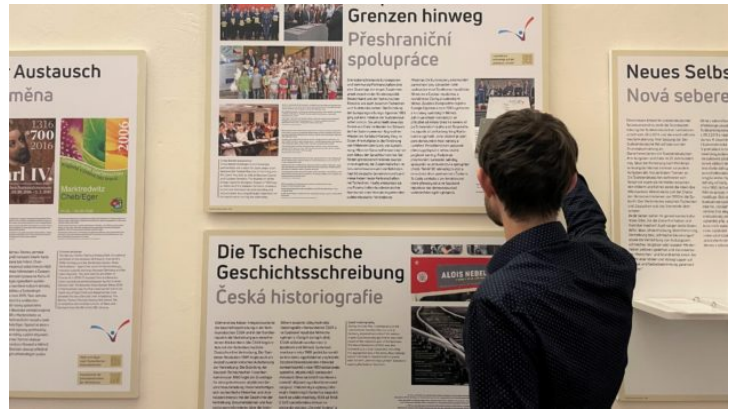
„So geht Verständigung – dorozumění“