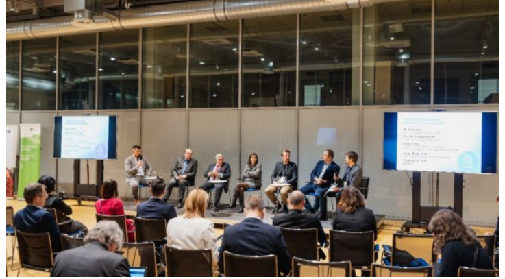
Netzwerktreffen „Sustainability and Space“ in Prag