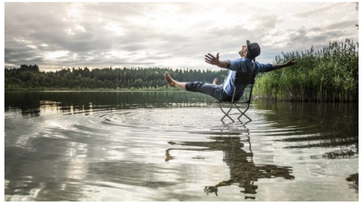
Bayern siebenmal anders: Batterien aufladen