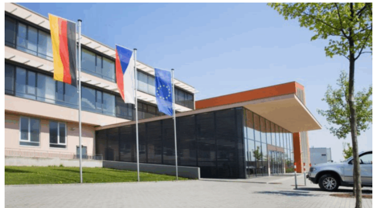
Zeitzeugengespräch an der Deutschen Schule Prag