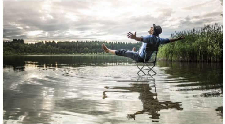
Bayern siebenmal anders: Batterien aufladen