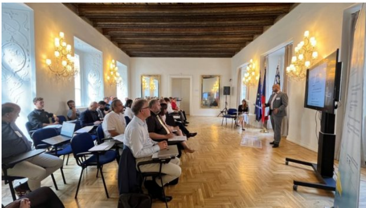
Bavarian-Czech AI and Robotics Workshop