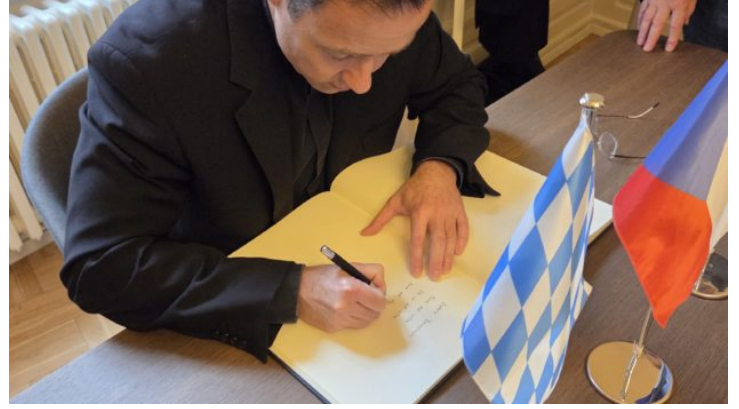
Priesterseminar St. Johannes der Täufer der Erzdiözese München ...