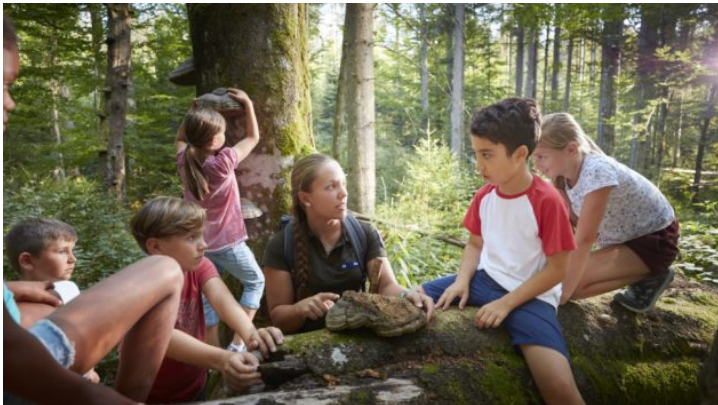
Vom Sofa nach Bayern: Wanderung durch den Nationalpark Bayerischer ...