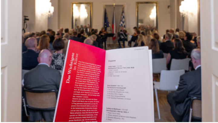
Konzert des Berganza-Quartetts der Bamberger Symphoniker in ...