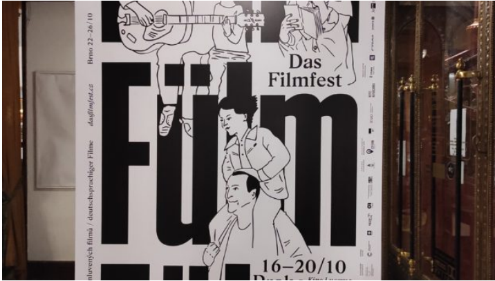
Festival deutschsprachiger Filme Das FILMFEST

Die Repräsentanz des Freistaats Bayern in der Tschechischen Republik intensiviert die Beziehungen Bayerns zur tschechischen Regierung, Zivilgesellschaft und Wirtschaft – über gemeinsame Projekte und Veranstaltungen und als Schaufenster Bayerns.