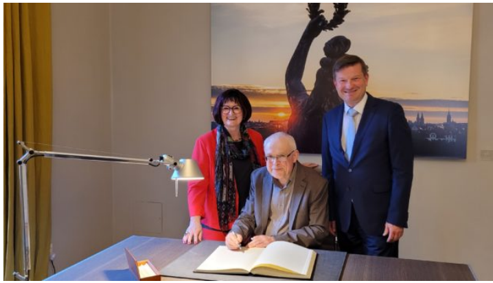
Vernissage der Ausstellung „Böhmen liegt nicht am Meer - ...“