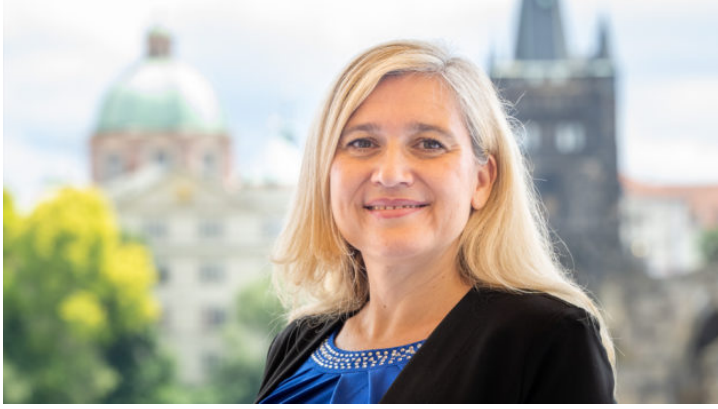
Europaministerin Huml in Prag