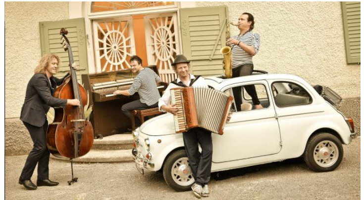
Weltmusik von bayerischer Band Quadro Nuevo – Online-Konzert ...