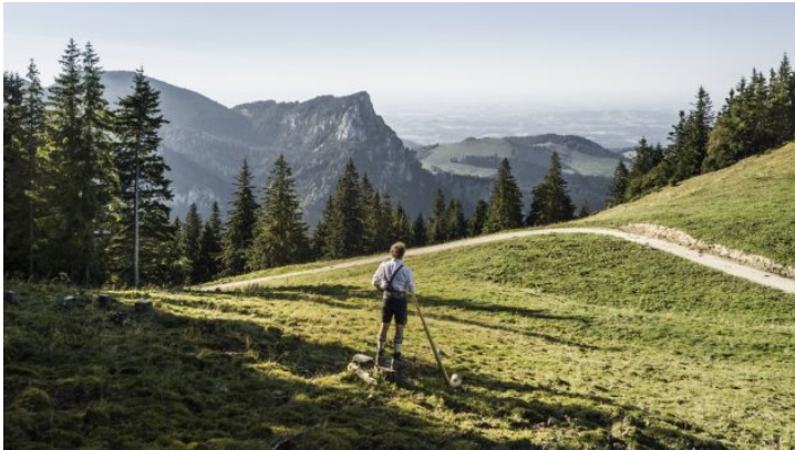
Vom Sofa nach Bayern: Alphornkonzert