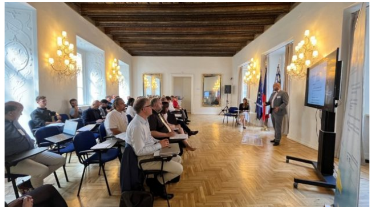
Bavarian-Czech AI and Robotics Workshop