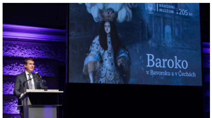
Eröffnung der bayerisch-tschechischen Landesausstellung in ...