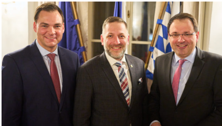
Bayerisch-tschechische Zusammenarbeit in der Grenzregion