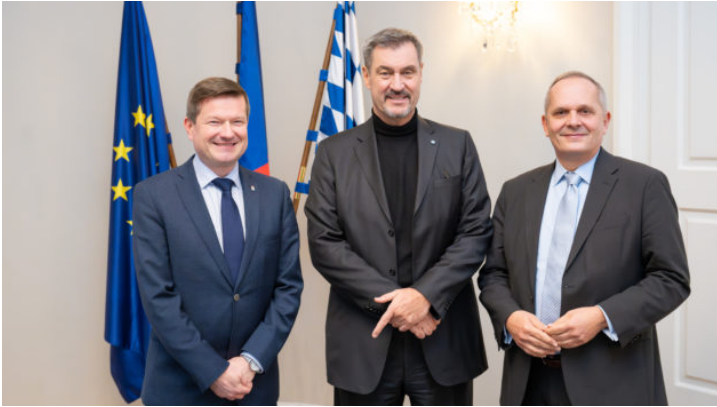
Besuch des Bayerischen Ministerpräsidenten in der Repräsentanz

Die Repräsentanz des Freistaats Bayern in der Tschechischen Republik intensiviert die Beziehungen Bayerns zur tschechischen Regierung, Zivilgesellschaft und Wirtschaft – über gemeinsame Projekte und Veranstaltungen und als Schaufenster Bayerns.