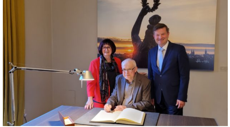
Vernissage der Ausstellung „Böhmen liegt nicht am Meer - ...