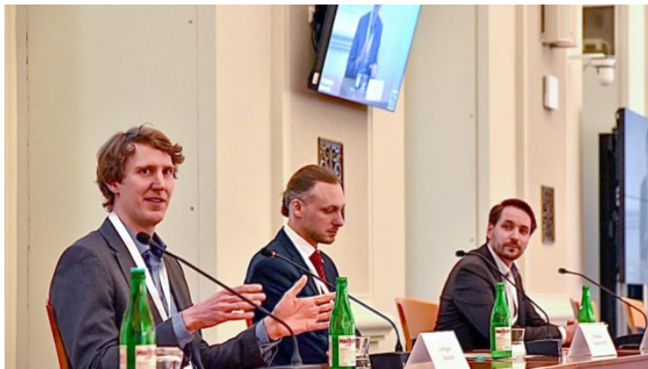
Deutsch-tschechischer Wasserstofftag in Prag