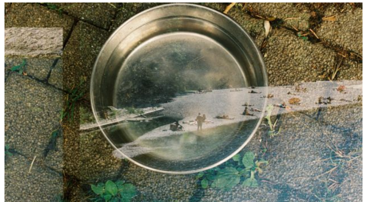
„Auf den zweiten Blick | Na druhý pohled“ Ein Fotoaustausch ...