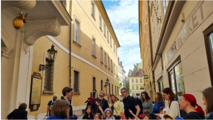
Bayern in Prag einmal anders

Die Repräsentanz des Freistaats Bayern in der Tschechischen Republik intensiviert die Beziehungen Bayerns zur tschechischen Regierung, Zivilgesellschaft und Wirtschaft – über gemeinsame Projekte und Veranstaltungen und als Schaufenster Bayerns.