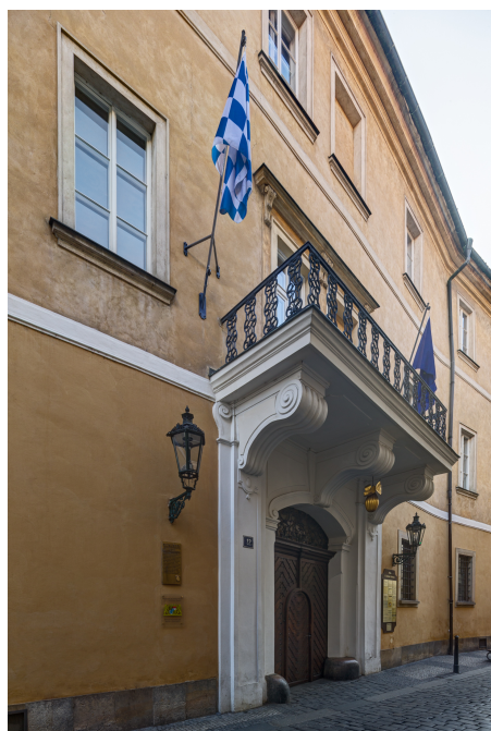
Bayerns Haus in Prag: Palais Chotek.

Das heutige Palais besteht aus zwei Trakten: dem nördlichen „ Haus zur goldenen Melone “ und dem südlichen Christopherus-Haus , später auch Reinhart-Haus genannt. Der gotische Nordtrakt stammt aus dem Jahr 1401 und wurde als Haus zur goldenen Melone im Jahr 1422 erstmals urkundlich erwähnt.