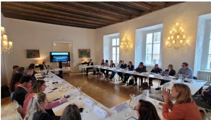
Fachaustausch mit der EUSPA