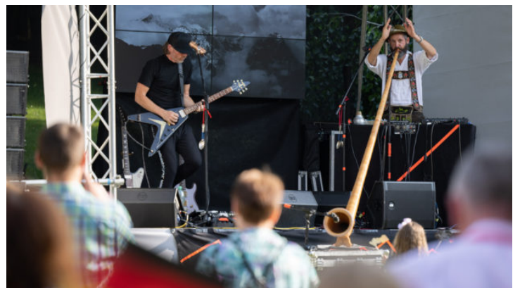
Bayern beim Tag der offenen Tür der Deutschen Botschaft in ...