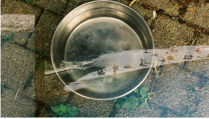
„Auf den zweiten Blick | Na druhý pohled“ Ein Fotoaustausch ...