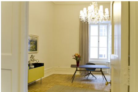
Räumlichkeiten der Bayerischen Repräsentanz in Prag.

Die Repräsentanz des Freistaats Bayern in Tschechien gewährt Besuchergruppen gerne Einblick in ihre Arbeit vor Ort.