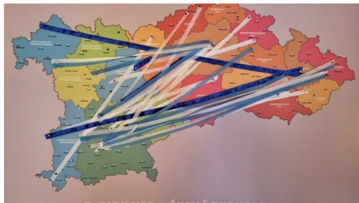
Česko-bavorské setkání učitelů