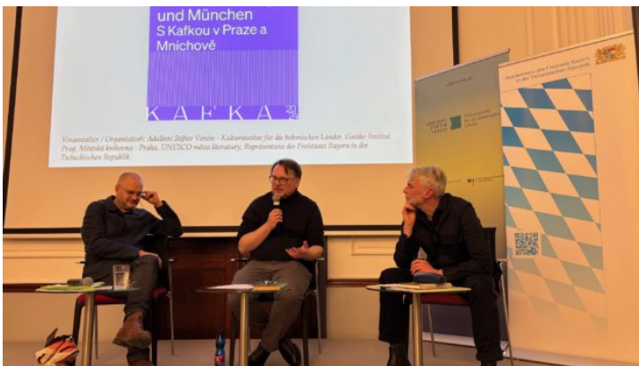
S Kafkou v Praze a Mnichově

Zastoupení Svobodného státu Bavorsko v České republice prohlubuje vztahy Bavorska s vládou České republiky, s českou občanskou společností a se zástupci hospodářství, a to prostřednictvím společných projektů a akcí, ale i jako „vizitka Bavorska“ v České republice.