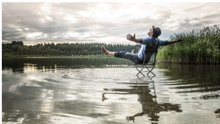
Bavorsko sedmkrát jinak: Dobijte si baterie