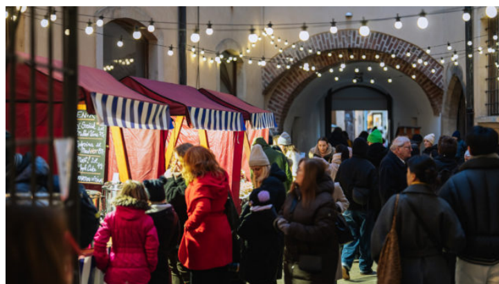
Adventní trh u příležitosti 10 let Bavorského zastoupení ...