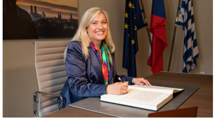
Bavorská ministryně Melanie Huml v Praze