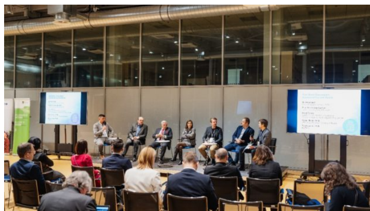
Pracovní setkání na téma „Sustainability and Space“ ...