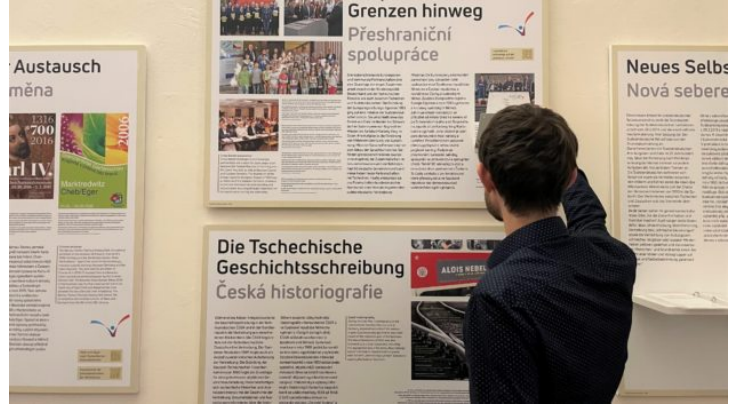
„So geht Verständigung – dorozumění“