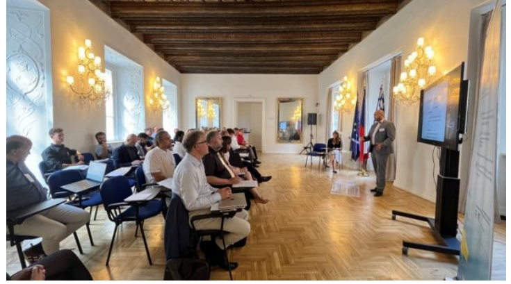
Bavarian-Czech AI and Robotics Workshop