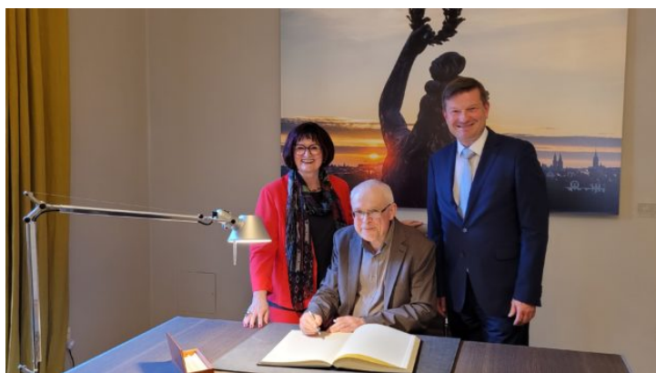
Vernisáž výstavy „Čechy neleží u moře“ na ...