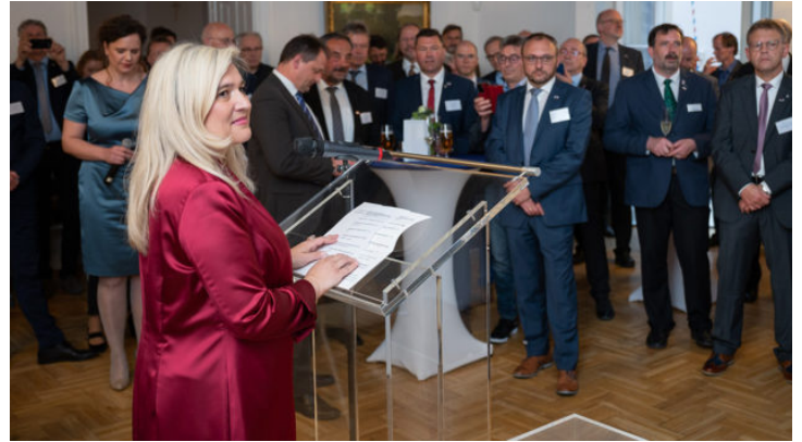
Den česko-bavorského komunálního partnerství v Praze s ...