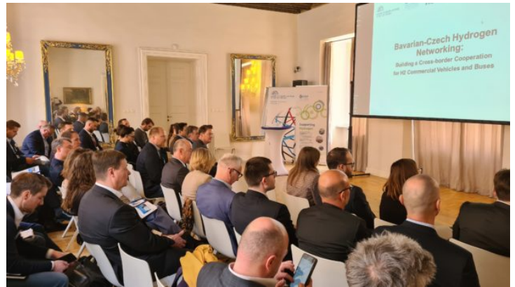
Bavarian-Czech Hydrogen Networking