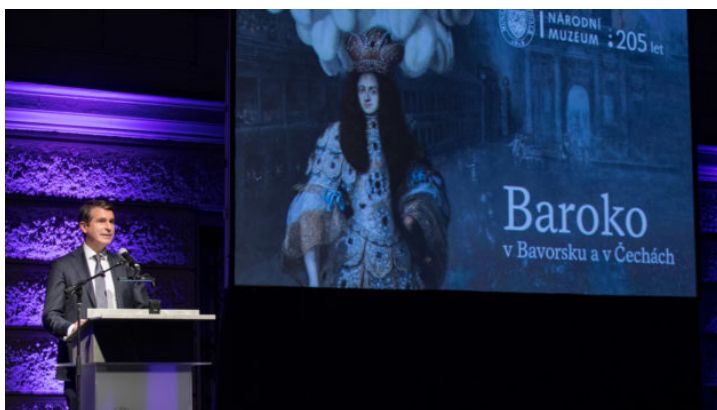
Zahájení česko-bavorské zemské výstavy v Praze