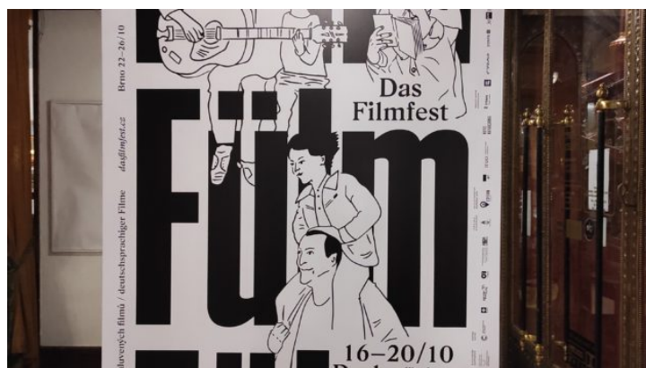
Festival německy mluvených filmů Das FILMFEST