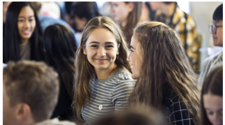
Česko-bavorský stipendijní program