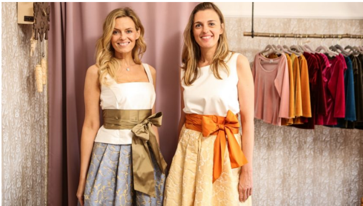
A co ty? Česko a Bavorsko v kulturním dialogu bez hranic