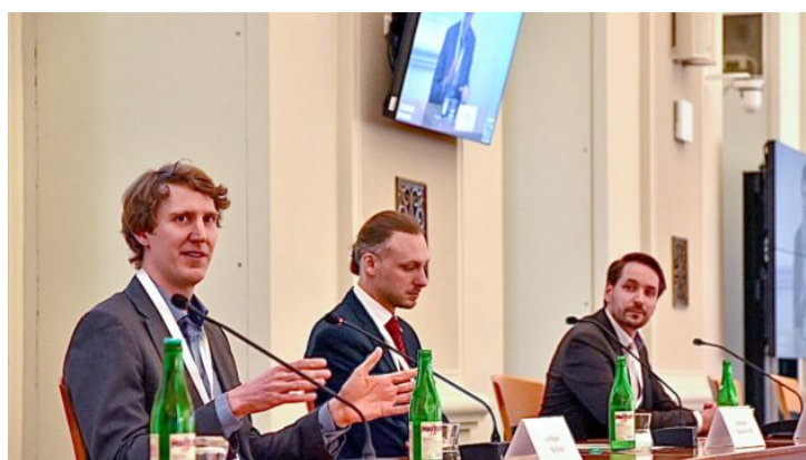
Česko-německý vodíkový den v Praze