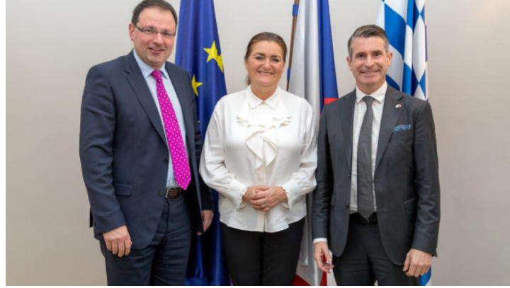
Novoroční recepce 2024