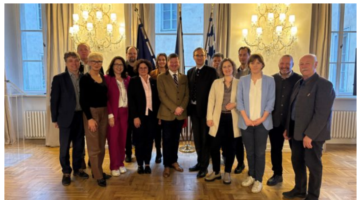
Výbor pro životní prostředí a ochranu spotřebitele bavorského ...