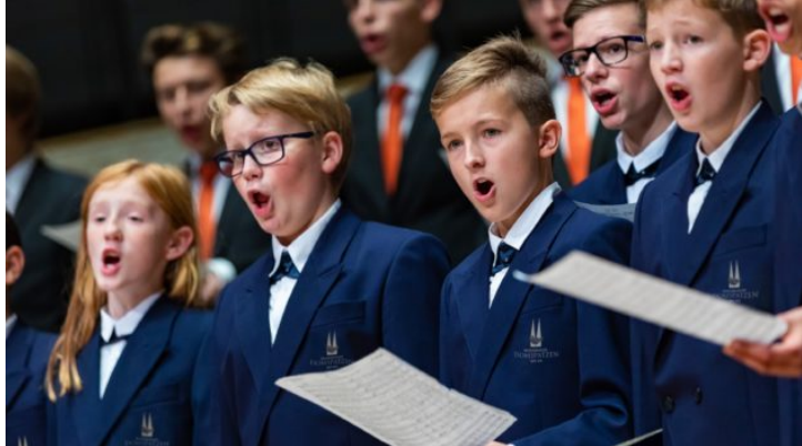
Turné sboru Regensburger Domspatzen v Česku – 10 let ...