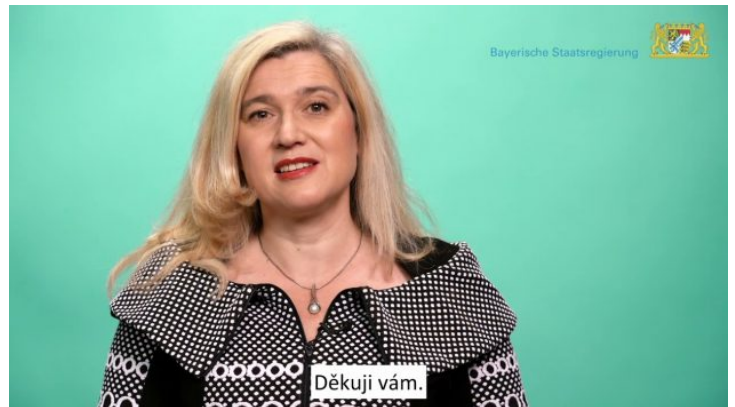
Bavorsko z pohodlí domova: Úvodní slovo bavorské ministryně ...