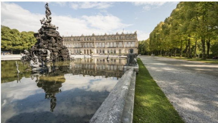
Bavorsko z pohodlí domova: Prohlídka zámku Herrenchiemsee