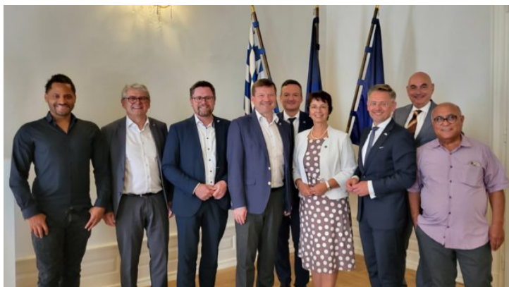
Návštěva Evropského výboru Bavorského zemského sněmu ...