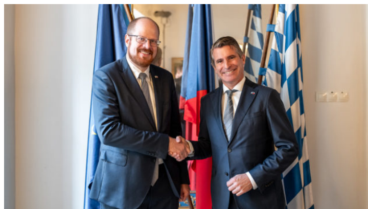
Slavnostní akt u příležitosti 10 let Bavorského zastoupení ...