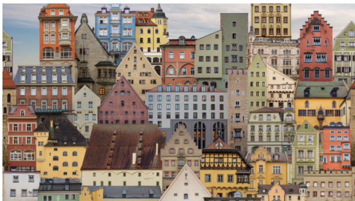
Proměněné fotografie – výstava umělkyně Leny Schabus