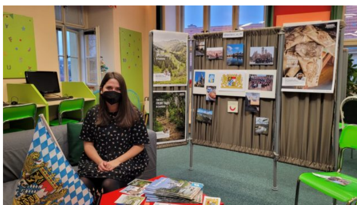
Živá knihovna pro studenty ve Slaném