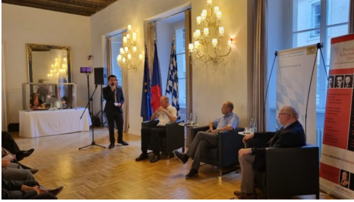
Literatura a dějiny v česko-bavorském dialogu