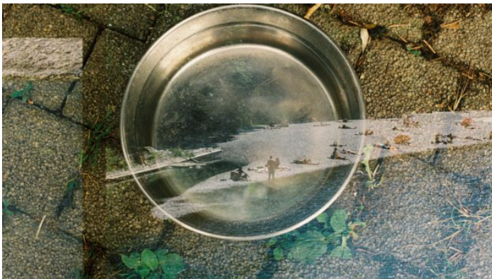
„Na druhý pohled | Auf den zweiten Blick“