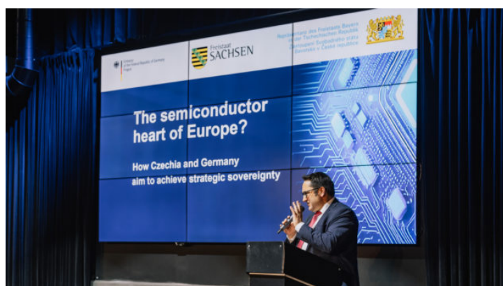
Inovační dny 2024