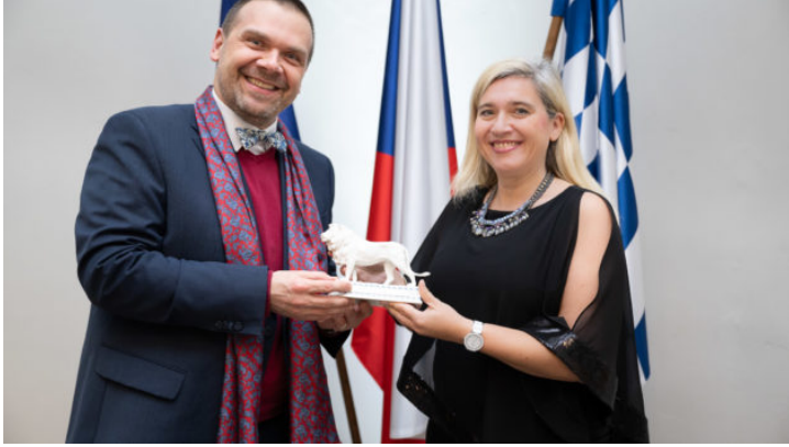
Novoroční recepce 2023