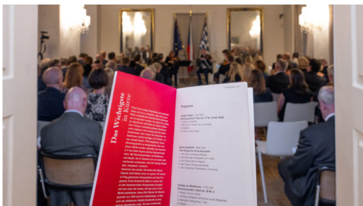
Koncert smyčcového kvarteta Berganza Bamberských symfoniků ...