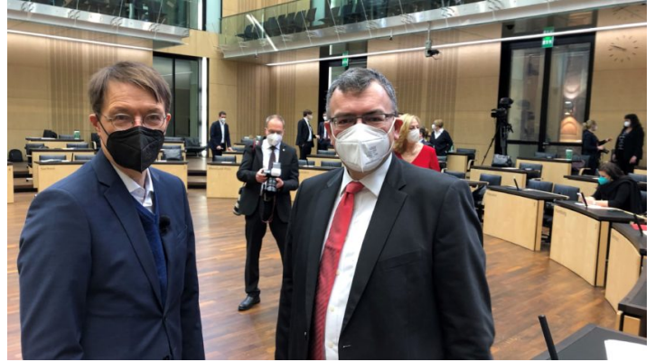
Sitzung des Bundesrates am 14. Januar 2022

Antrittsrede von Bundeskanzler Scholz im Bundesrat / Bayern bringt Initiativen u.a. zu Wohnungsbau ein