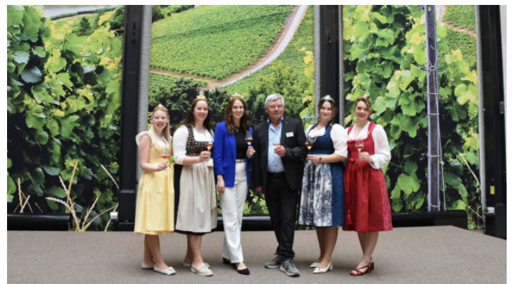
Die Zeit ist reif für Frankenwein / Schlenderweinprobe