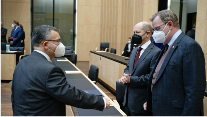
Sitzung des Bundesrates am 11. Februar 2022

Ukraine-Debatte / Bayerische Initiative für ein Sofortprogramm zur Neuausrichtung der Bundeswehr und Reform der Sicherheitsarchitektur / Weitere bayerische Initiativen für eine absolute Energiepreisbremse und zur Bekämpfung der Kinderpornografie