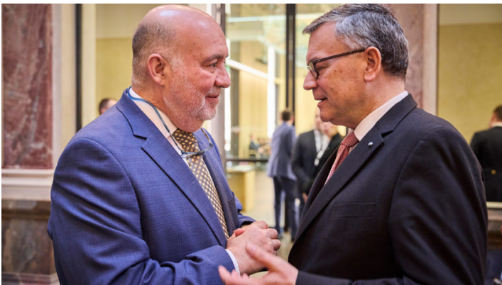
Sitzung des Bundesrates am 6. März 2026

Ministerpräsident Dr. Markus Söder: „Wir sagen hohen Spritpreisen den Kampf an“