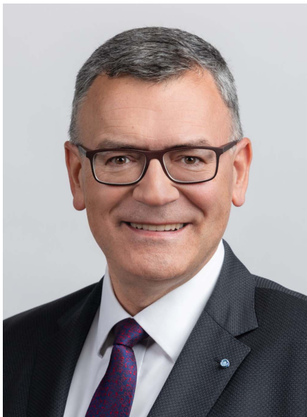
Porträt: Staatsminister Dr. Florian Herrmann, MdL

Staatsminister Dr. Florian Herrmann ist Leiter der Staatskanzlei und Staatsminister für Bundesangelegenheiten und Medien. Er ist als „Bayerns Bundesratsminister“ der Vertreter des Freistaats in Berlin und Stimmführer Bayerns im Bundesrat . Er wirbt für bayerische Anliegen und bringt das Gewicht des Freistaats in bundespolitische Entscheidungen ein. In Gesprächen mit Vertretern von Presse, Wirtschaft und Verbänden erläutert er die politischen Positionen des Freistaats.