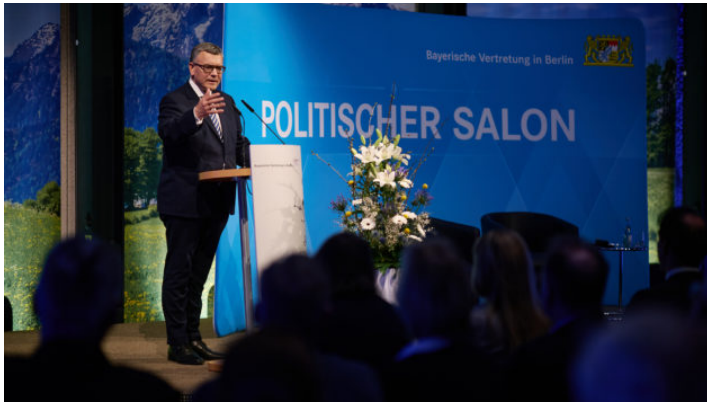
Staatsminister Dr. Florian Herrmann beim Politischen Salon mit ...