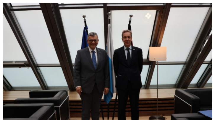
Besuch des Botschafters von Griechenland