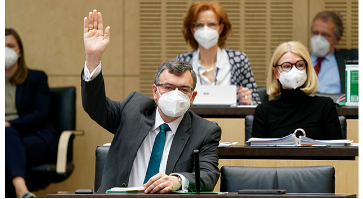
Sitzung des Bundesrates am 7. Mai 2021

Mehr Klimaschutz und Ausbau Ganztagsförderung