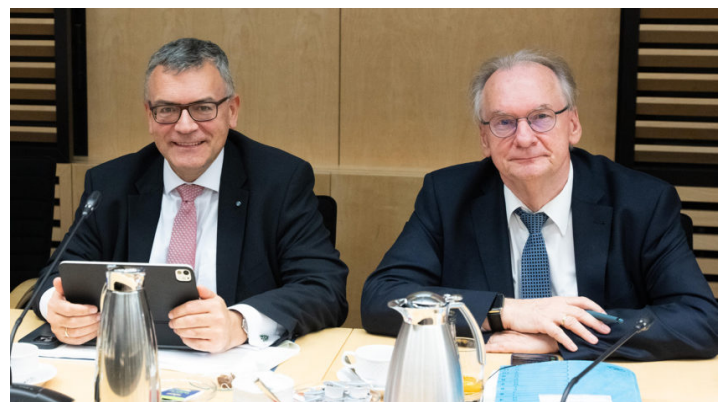
Vermittlungsausschuss im Bundesrat am 17.12.2025