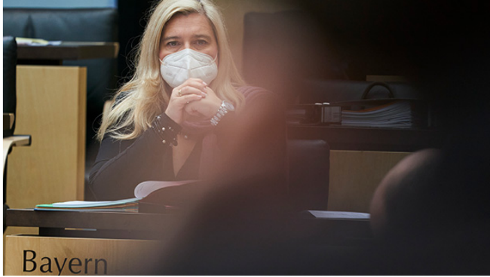
Sitzung des Bundesrates am 28. Mai 2021

Mehr Klimaschutz und Ausbau Ganztagsförderung