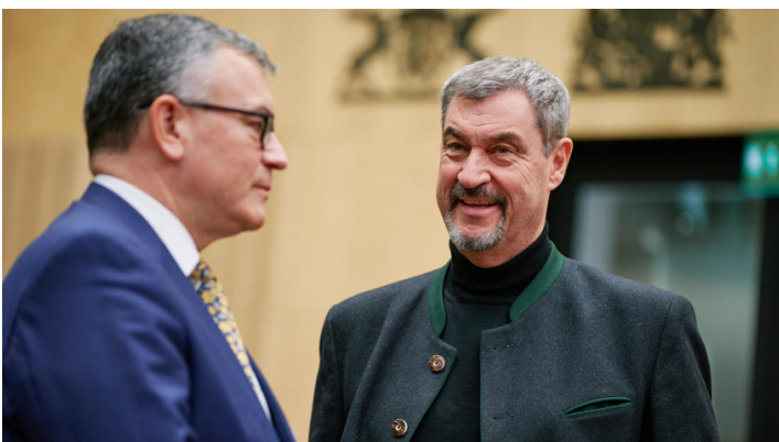
Sitzung des Bundesrates am 19. Dezember 2025