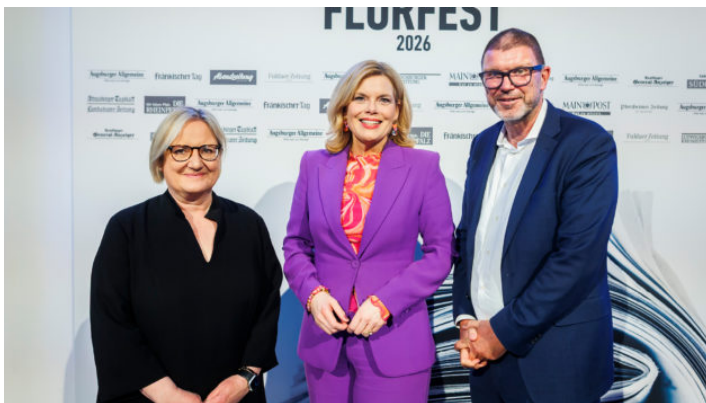
Flurfest der Augsburger Allgemeinen