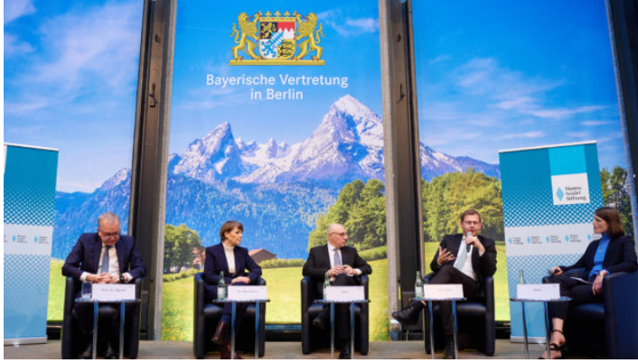
Zwischen Spionage und Sabotage – Sicherheitspolitische Herausforderungen ...