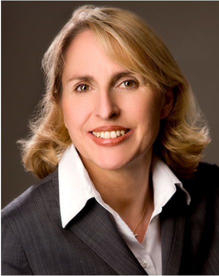
Porträt: Staatsrätin Karolina Gernbauer

An der Spitze der Vertretung steht Staatsrätin Karolina Gernbauer als Bevollmächtigte des Freistaates Bayern beim Bund .