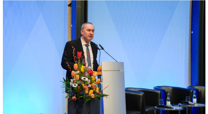
Parlamentarischer Abend zum Thema „Unabhängigkeit der Freien ...