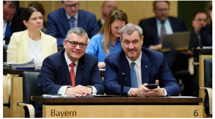
Sitzung des Bundesrates am 27. März 2026