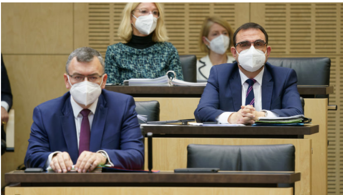
Sitzung des Bundesrates am 17. Dezember 2021

Sondersitzung zu weiteren Corona-Maßnahmen / Weg frei für neue Quarantäneregelungen