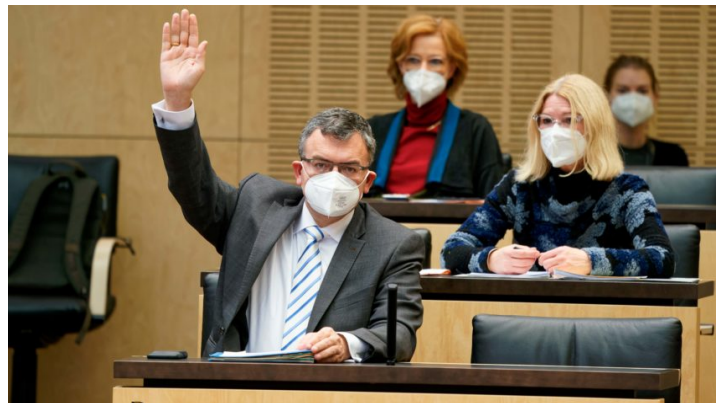
Sitzung des Bundesrates am 10. Dezember 2021

Bayern fordert Gehaltsverdoppelung für Intensivpflegekräfte