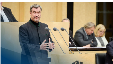
Ministerpräsident Dr. Markus Söder bei einer Rede im Bundesrat.

Ausgehend vom Bundesrat als Länderkammer begleitet die Vertretung schwerpunktmäßig die Gesetzgebung des Bundes. Jedes Bayerische