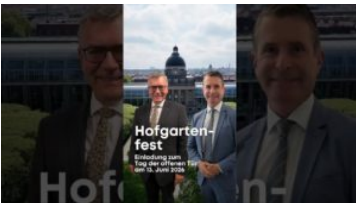
Hofgartenfest und Tag der offenen Tür am 13. Juni 2026 – ...