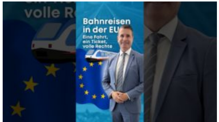
Bahnreisen in der EU- Bayern