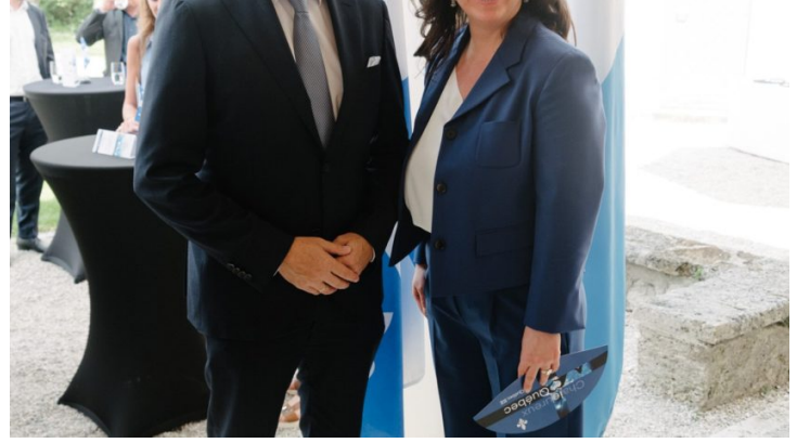
Empfang anlässlich des Nationalfeiertags von Québec