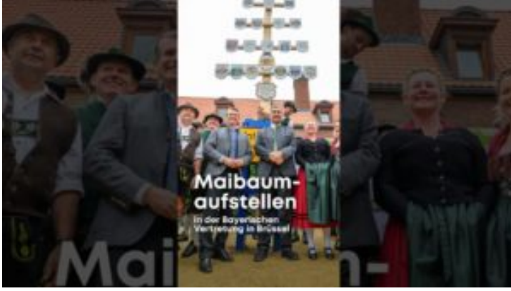
Maibaumaufstellen in der Bayerischen Vertretung in Brüssel ...