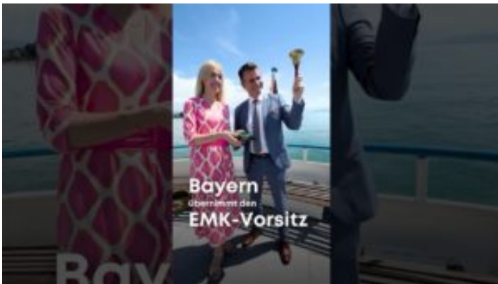
EMK-Vorsitz – Bayern