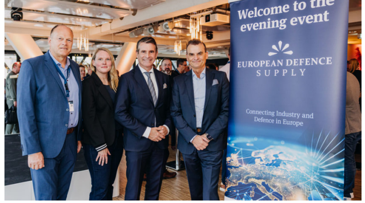
European Defence Supply Conference