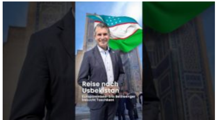
Reise nach Zentralasien: Besuch der Republik Usbekistan ☐☐ ...