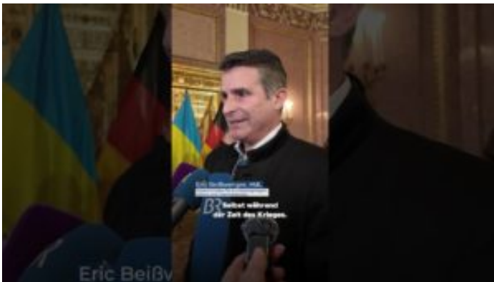
13. Sitzung der Bayerisch-Ukrainischen Arbeitskommission - ...