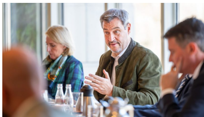
Kabinettsitzung am 10. März 2025