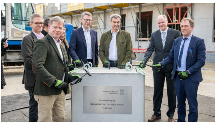
LMU Klinikum München: Grundsteinlegung für „Das Neue Hauner“ ...