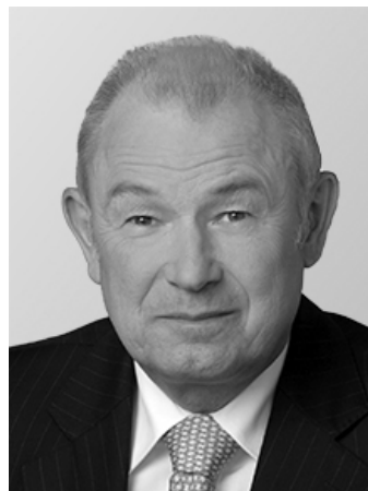
Dr. Günther Beckstein