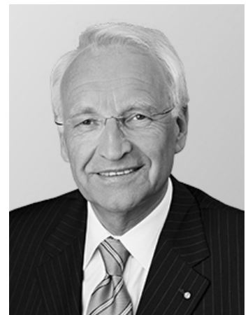
Dr. Edmund Stoiber