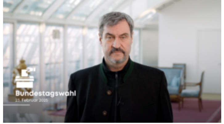
Wahlauf Ruf zur Bundestagswahl 2025 - Bayern