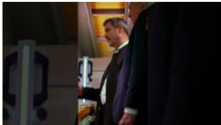
ZUKUNFT HANDWERK und 75. Internationale Handwerksmesse - ...