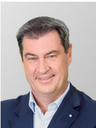
Dr. Markus Söder, MdL