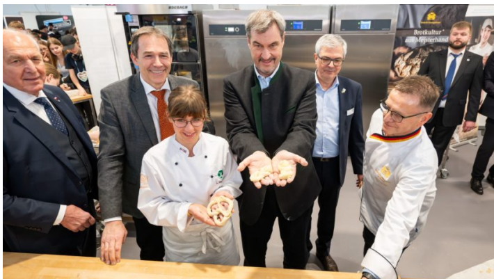
Eröffnung der Messe ZUKUNFT HANDWERK 2025