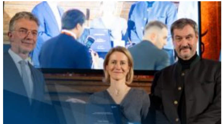
Video in Gebärdensprache: Statements zur Verleihung des Ewald-von-Kleist-Preises ...