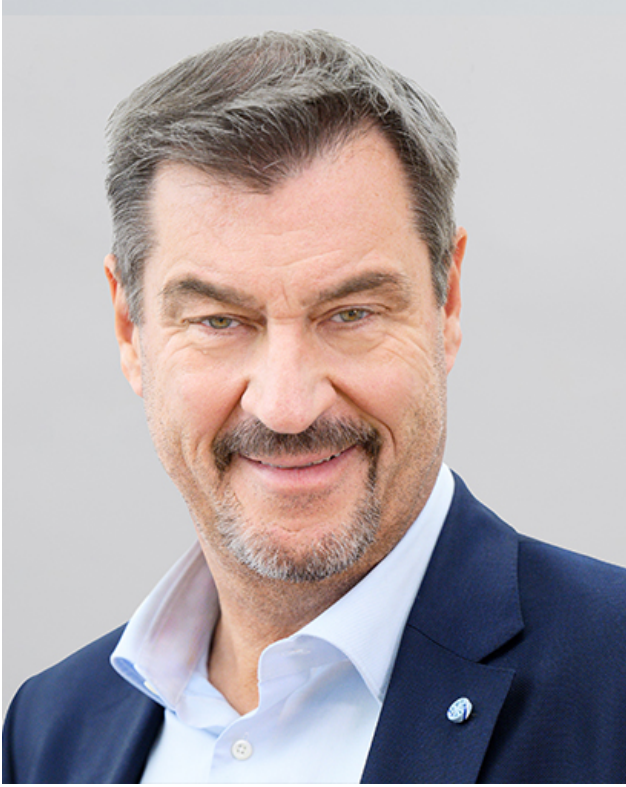
Porträt: Dr. Markus Söder, MdL

Geboren am 5. Januar 1967 in Nürnberg, verheiratet, vier Kinder