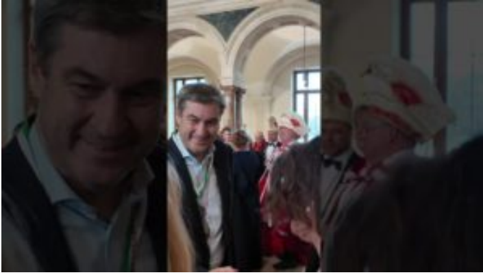
Unsinniger Donnerstag 2025 in der Bayerischen Staatskanzlei ...