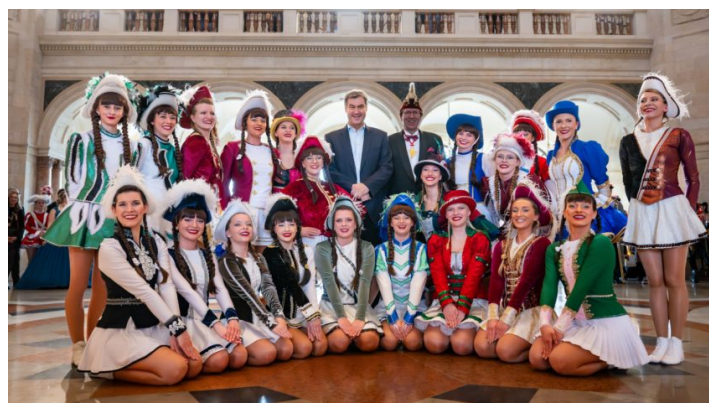
„Unsinniger Donnerstag“ 2025