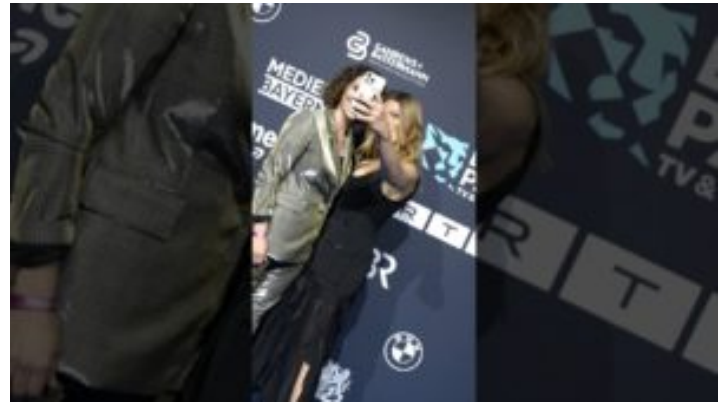
Blauer Panther – TV & Streaming Award 2025