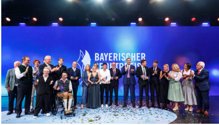
Bayerischer Sportpreis 2025