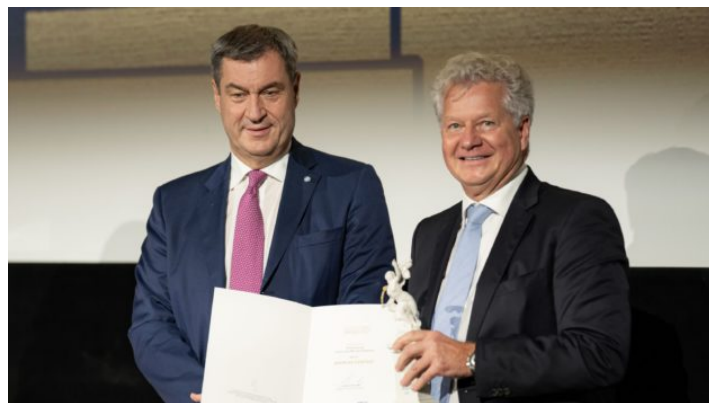
Bayerischer Printpreis 2023