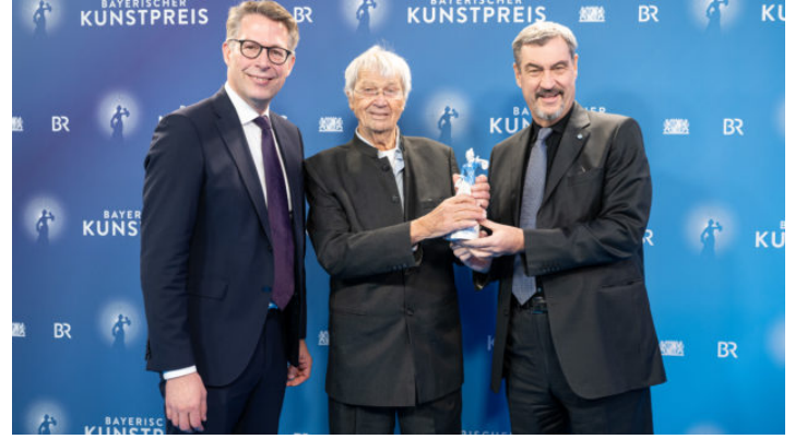
Verleihung des Bayerischen Kunstpreises