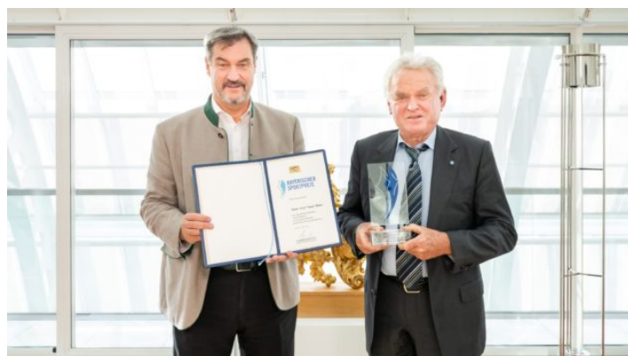
Bayerischer Sportpreis 2024 in der Kategorie „Persönlicher ...“