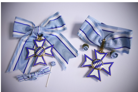
Bayerischer Verdienstorden in der Kategorie Frauen (links) und Männer (rechts).

Er symbolisiert den herausragenden Einsatz und das außerordentliche Engagement der Bürger im Freistaat für das Gemeinwesen. Die Zahl der Ordensinhaber soll 2.000 nicht überschreiten.