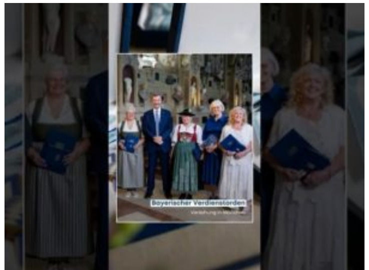
Verdienstordens 2025 – Bayern ...