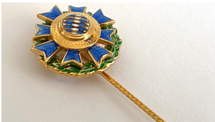
Ehrenzeichen des Bayerischen Ministerpräsidenten für Verdienste im Auslandseinsatz.

Das Ehrenzeichen des Bayerischen Ministerpräsidenten für Verdienste im Ehrenamt wird seit 1994 als ehrende Anerkennung für langjährige hervorragende ehrenamtliche Tätigkeit verliehen. Der Ministerpräsident verleiht sein Ehrenzeichen an Personen, die sich mit ihrer aktiven Arbeit in Vereinen, Organisationen und sonstigen Gemeinschaften mit kulturellen, sportlichen, sozialen oder anderen gemeinnützigen Zielen hervorragende Verdienste erworben haben – vorrangig im örtlichen Bereich und seit mindestens 15 Jahren.