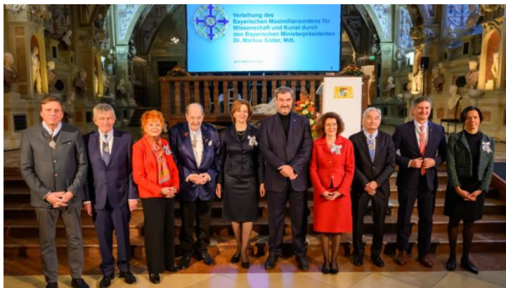
Bayerischer Maximiliansorden 2025