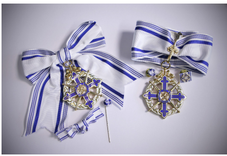
Bayerischer Maximiliansorden in der Kategorie Frauen (links) und Männer (rechts).

Ausgezeichnet werden vorzugsweise deutsche Wissenschaftler und Künstler. Der Orden wird in einer Klasse an Männer und Frauen verliehen.