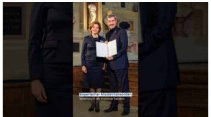
Verleihung des Bayerischen Maximiliansordens 2025 – Bayern ...