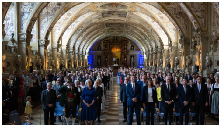
Bayerischer Verdienstorden 2025