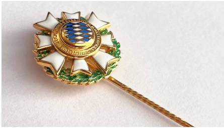
Ehrenzeichen des Bayerischen Ministerpräsidenten für Verdienste im Ehrenamt.

Das Ehrenzeichen des Bayerischen Ministerpräsidenten für Verdienste im Ehrenamt wird seit 1994 als ehrende Anerkennung für langjährige hervorragende ehrenamtliche Tätigkeit verliehen. Der Ministerpräsident verleiht sein Ehrenzeichen an Personen, die sich mit ihrer aktiven Arbeit in Vereinen, Organisationen und sonstigen Gemeinschaften mit kulturellen, sportlichen, sozialen oder anderen gemeinnützigen Zielen hervorragende Verdienste erworben haben – vorrangig im örtlichen Bereich und seit mindestens 15 Jahren.