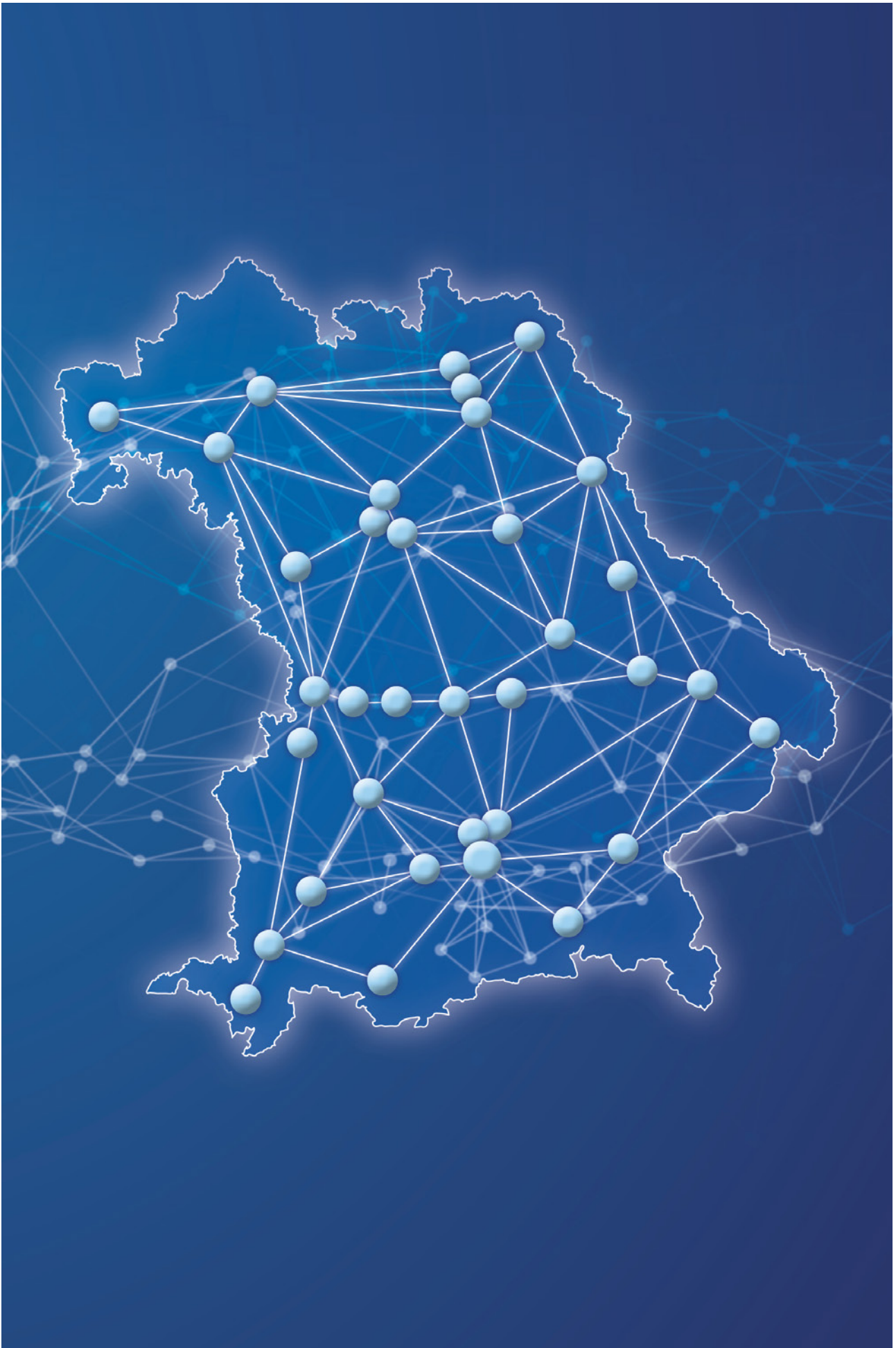
Zukunft durch Vernetzung: Das ganze Land profitiert von der Hightech Agenda Bayern.