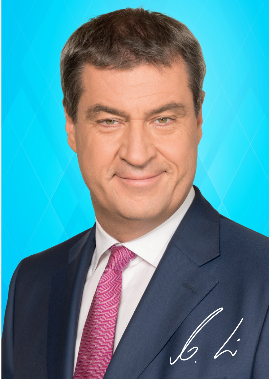
Dr. MARKUS SÖDER, MdB Bayerischer Ministerpräsident